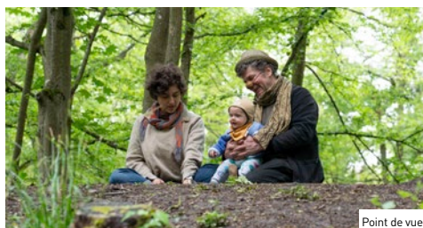
Point de vue