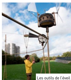
Les outils de l'éveil