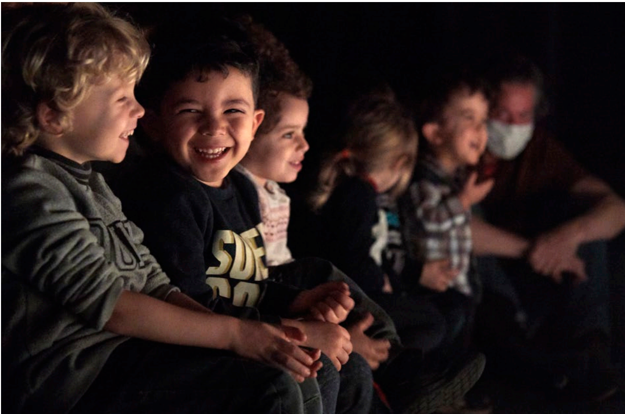
© Tiphaine Larvin - Festival Jeune et Très Jeune Public 2021 - Gennevilliers

en tant que vecteur de transmission des émotions et de lien entre la mère et le tout-petit enfant. Par l'adaptation de son rythme et de son intensité aux différentes étapes de l'endormissement, la voix qui berce constitue une enveloppe sonore, qui par sa présence facilite la séparation.