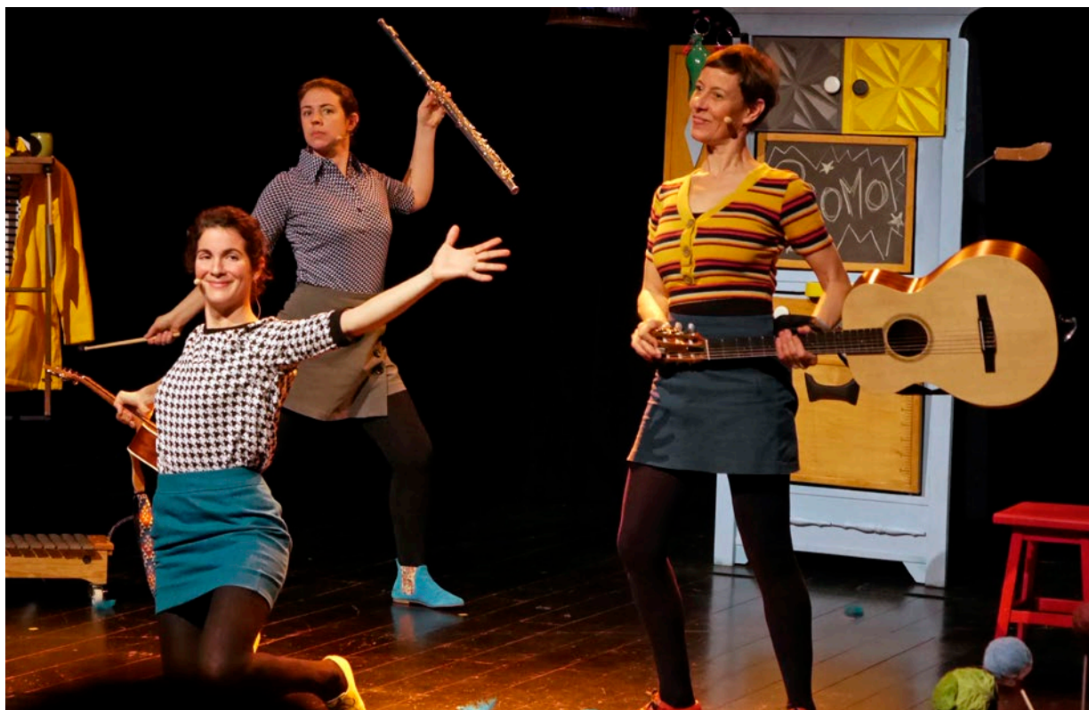
© Karine Michélin - Festival Jeune et Très Jeune Public 2021 - Gennevilliers - Compagnie Jeannot Jeannette

Une édition exceptionnelle à plus d'un titre... Des professionnels de la culture et de la petite enfance expriment les raisons de leur présence